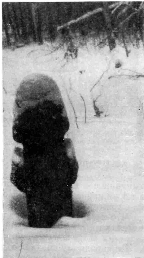
Рис. 1. Крест в момент его обнаружения

Скорее всего, это — отзвуки знаменитой битвы при Молодях (1571 г.), когда отдельные группы разгромленных войск Девлет-Гирея преследовались в лесах по Лопасне.