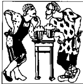
Продажа вина в Кетске в 1695–1703 гг.

Как показывают Таможенные книги, Кузнецк был впереди остальных городов Томского разряда по суммам налоговых поступлений от торговли, уступая лишь самому Томску. Интенсивность торговли во многом и обусловила достаточно большие объемы потребления в городе спиртного и суммы питейных доходов, которые превосходили все остальные источники бюджетных поступлений.