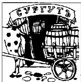
Сургутский кружечный двор в начале XVIII в.

Город Сургут был основан летом 1594 г. в бассейне р. Оби неподалеку от владений остяцкого князя Бардака отрядом русских служилых людей во главе с князем Ф. Борятинским 289 . Первоначально он являлся одним из опорных пунктов русской колонизации Сибири и использовался, в частности, для отражения набегов князца нарымских селькупов Вони. В конце XVI — начале XVII в. город представлял собой крепость с военно-административными функциями и был населен только служилыми людьми. Внешне это был деревянный рубленый острог с двумя воротами и пятью башнями. Служилый «мир» Сургута был довольно пестр. В окладных книгах XVII в. встречаются названия стрельцы и казаки, во главе которых стояли стрелецкие сотники и атаманы 290 .